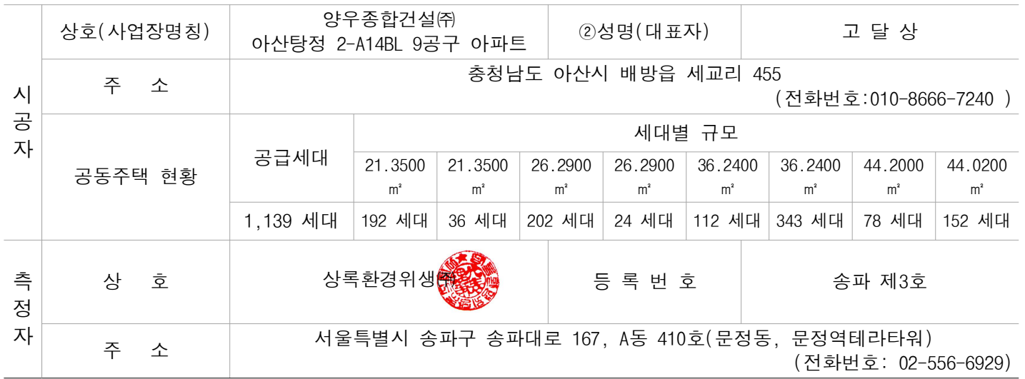
공동주택 공기질 측정결과(단위: \mu\text{g}/\text{m}^3 또는 \text{Bq}/\text{m}^3 )